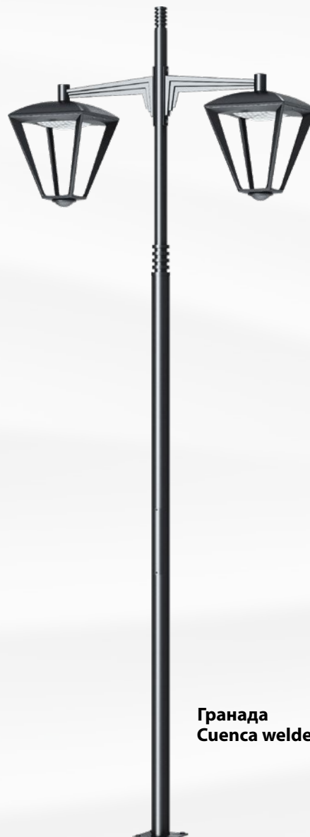
Гранада Suenca welded