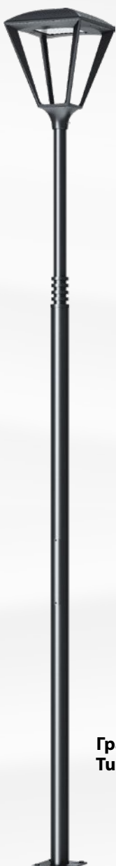
Гранада Tudela welded