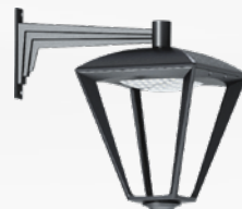
Гранада Suenca welded Комплект (светильник + кронштейн)