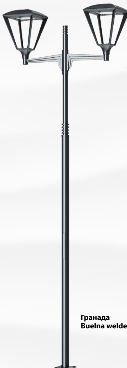
Гранада Buelna welded