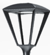
Гранада Tudela welded Светильник