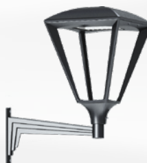
Гранада Buelna welded Комплект (светильник + кронштейн)