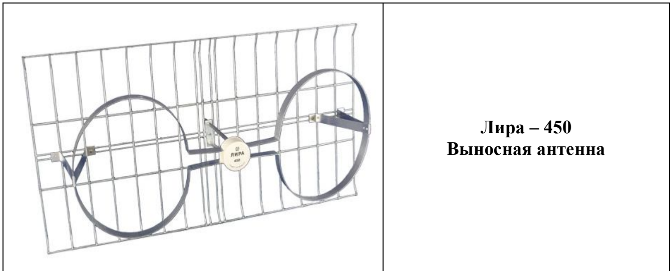
Лири – 450 Выносная антенна