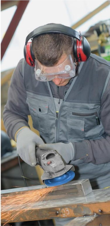
Упаковка: картонный конверт / *данный артикул представлен на фото

Шлифовальные инструменты ЗУБР отличаются высокой производительностью, увеличенным рабочим ресурсом и универсальностью при обработке дерева, металла и других материалов.