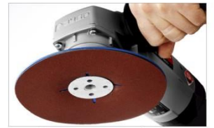
Максимально надежная фиксация фибрового круга

Применяется для жесткой фиксации фибрового круга на УШМ при выполнении предварительных, промежуточных и финишных шлифовальных работ.