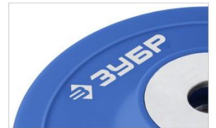
Ребро жесткости усиливает конструкцию