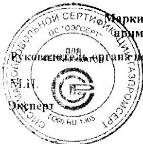
Схема сертификации №1С Маркирование продукции производить в соответствии с порядком применения знака соответствия Системы ГАЗПРОМСЕРТ для эксперта И.П.